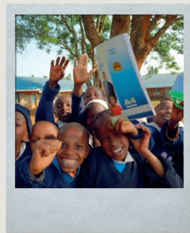
Kikuju i Masaje to najliczniej reprezentowane społeczności w Ndeiya i jej okolicach. Podczas gdy Kikuju głównie zajmują się rolnictwem, domena Masajów jest wypas bydła.

To był cud. Gdy prawie wyrzucono mnie z liceum ze względu na niezapłacone czesne, ktoś – do dzisiaj nie wiem kto – wpłacił na konto szkoły prawie całą zaległą sumę. Resztę, w tajemnicy przed bratem, wpłaciła moja mama. Dyrektor mojego liceum był również bardzo wyrozumiały. Doskonale wiedział, że nie mogę wrócić do domu. Dlatego po maturze dostałam pracę w dziale