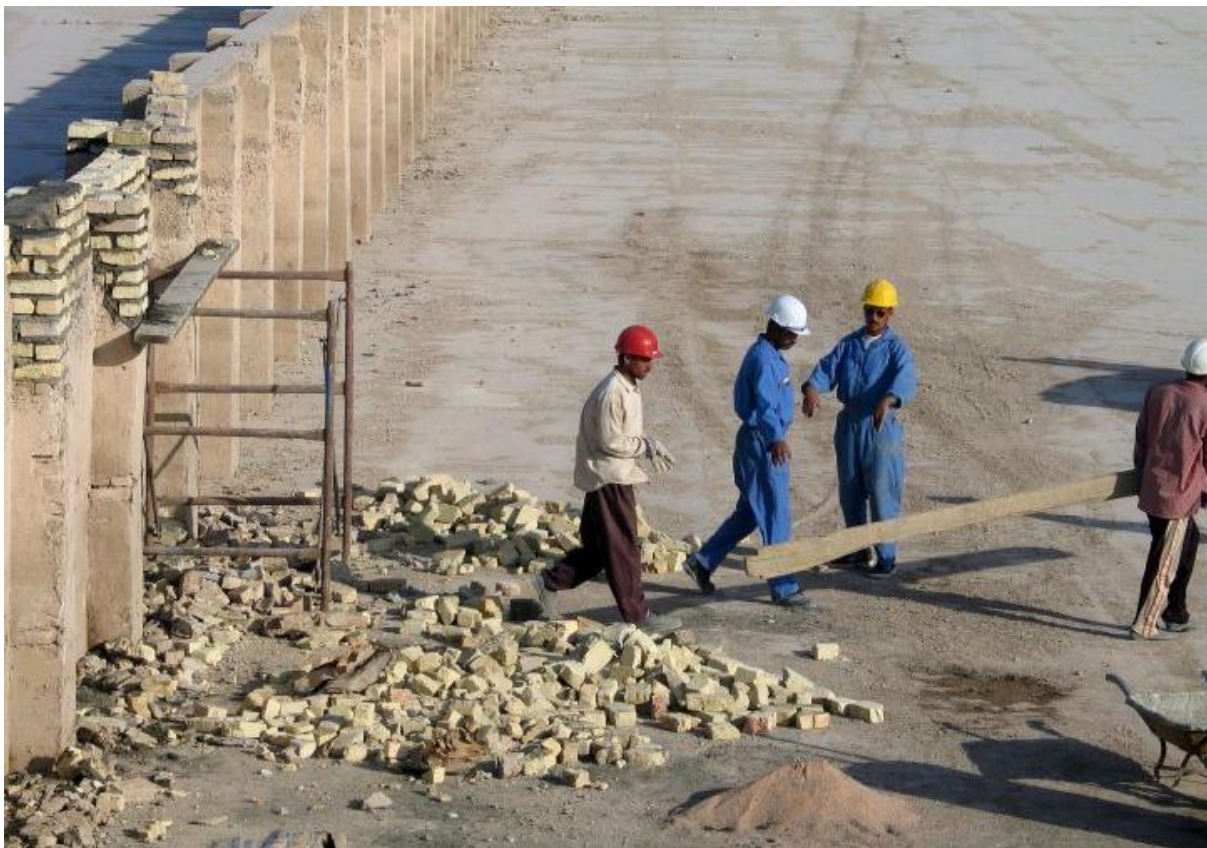
Mężczyźni pracujący nad budową kanału (Jemen).