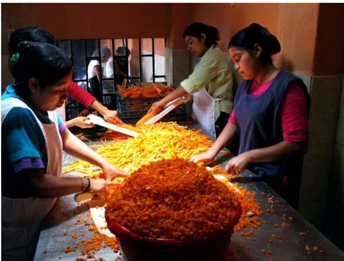
Kobiety pracujące w przetwórni owoców (Gwatemala). Fot. USAID. Licencja CC0.