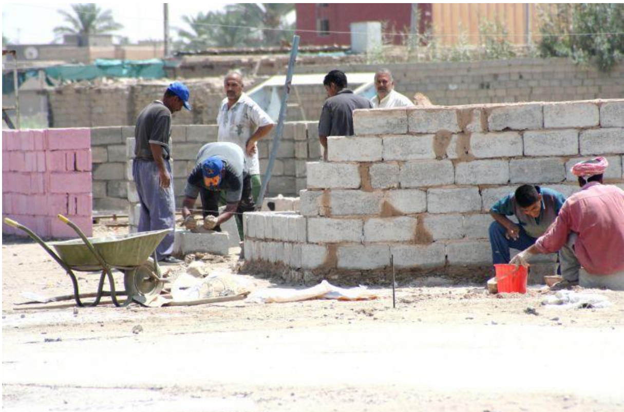
Mężczyźni pracujący na budowie (Irak). Fot. USAID. Licencja CC0