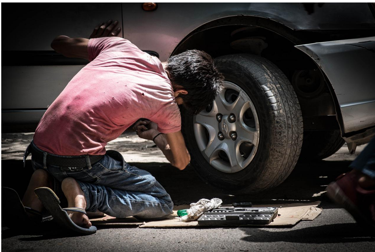
Mechanik samochodowy. Fot. nieznany. Licencja CC0