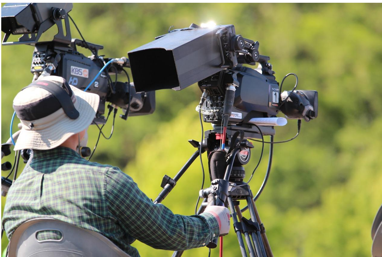
Operator kamery przy pracy. Fot. nieznany. Licencja CC0.