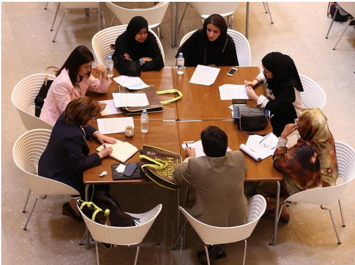
Badaczki i eksperci z Sudanu, Jemenu, Egiptu i Arabii Saudyjskiej dyskutują studium przypadku (Doha). Fot.: International Labour Organization. Licencja CC BY-NC-ND 3.0 IGO