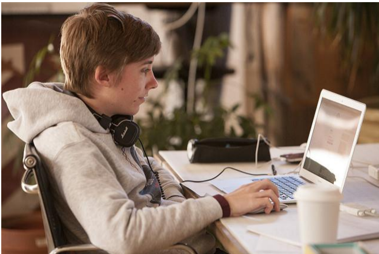
Programista przy pracy (USA).