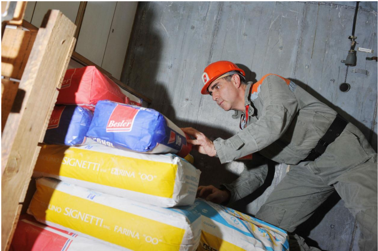
Inspektor sprawdza warunki przechowywania żywności na Bułgarskim statku (Włochy). Fot. Marcel Crozet, International Labour Organization. Licencja CC BY-NC-ND 3.0 IGO