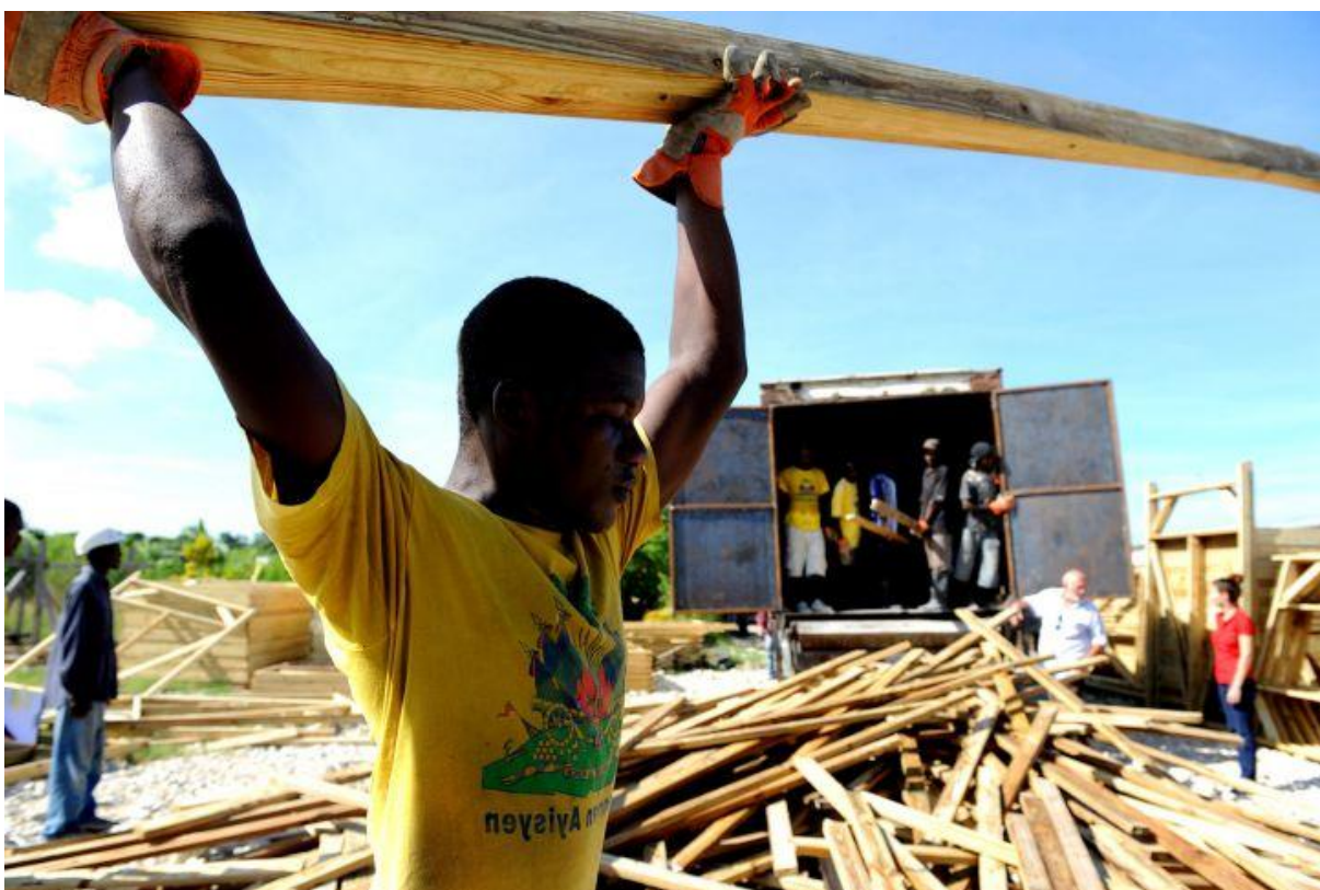
Mężczyźni przygotowują transport materiałów budowlanych (Haiti). Fot. USAID. Licencja CC0