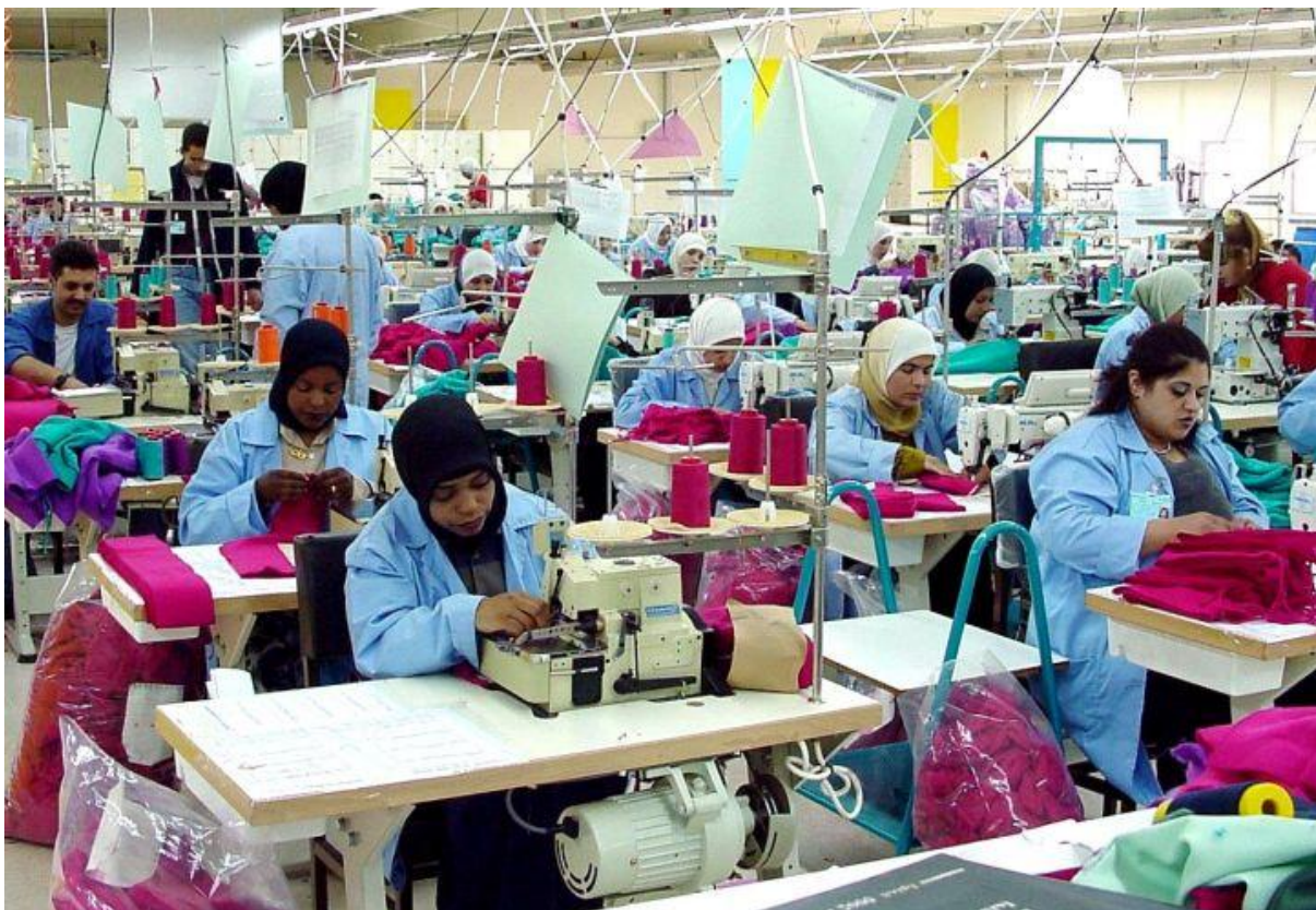
Kobiety pracujące w fabryce odzieży (Jordan). Fot. USAID. Licencja CC0.