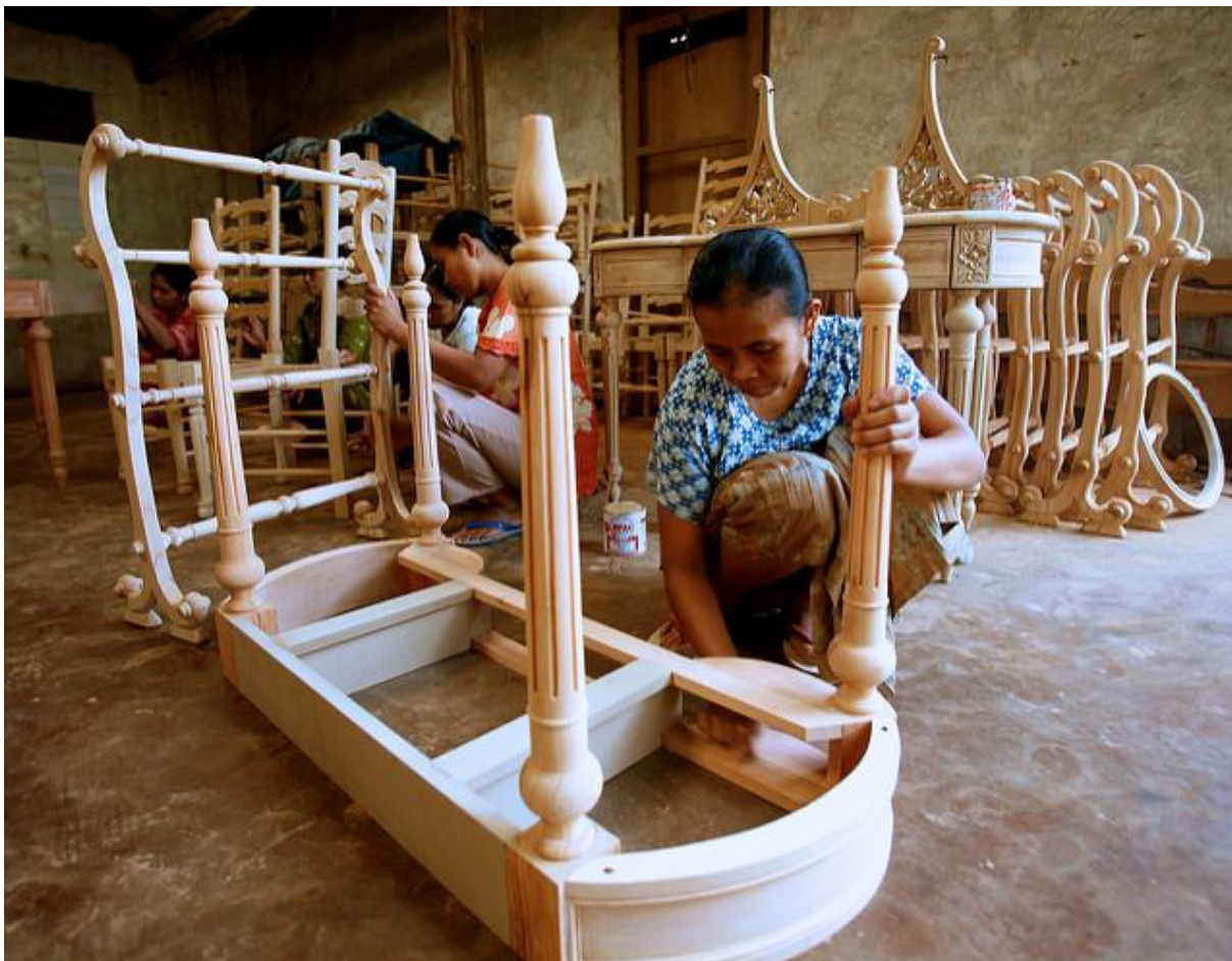
Kobiety pracujące przy produkcji mebli. Fot. Murdani Usman, Center for International Forestry Research. Licencja CC BY-NC-ND 2.0