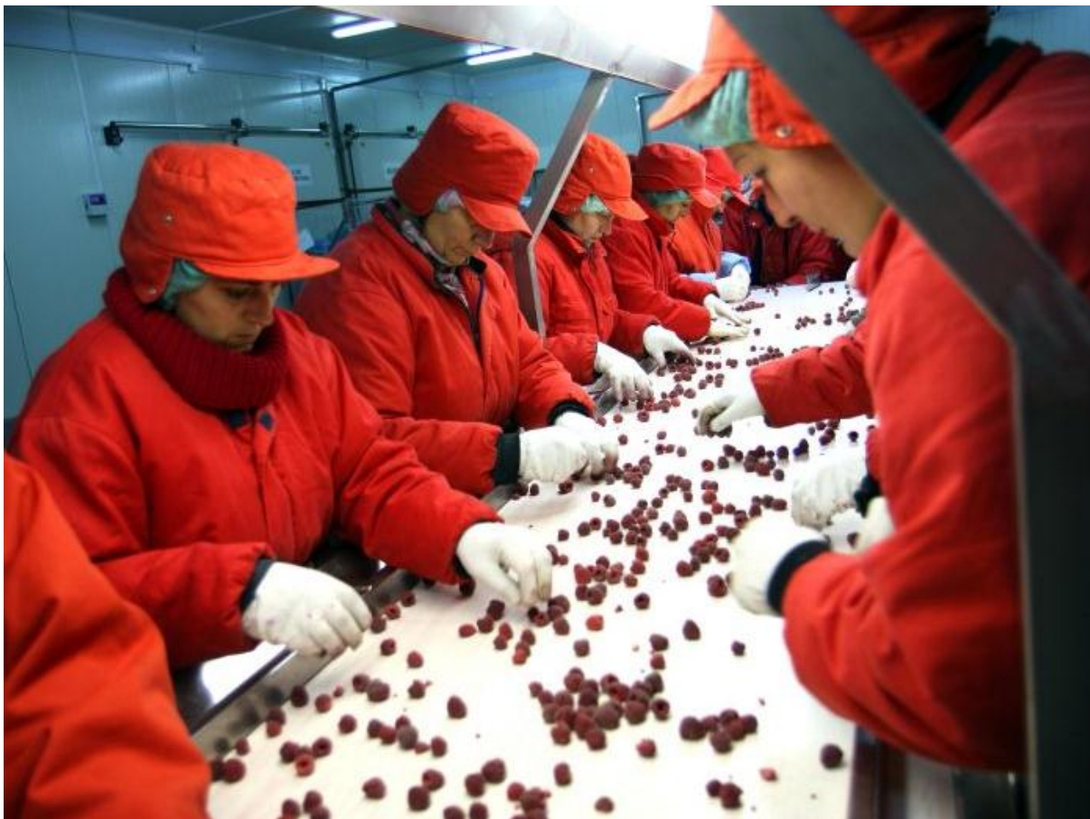
Kobiety przy pracy w mroźni owoców. Fot. USAID. Licencja CC0.