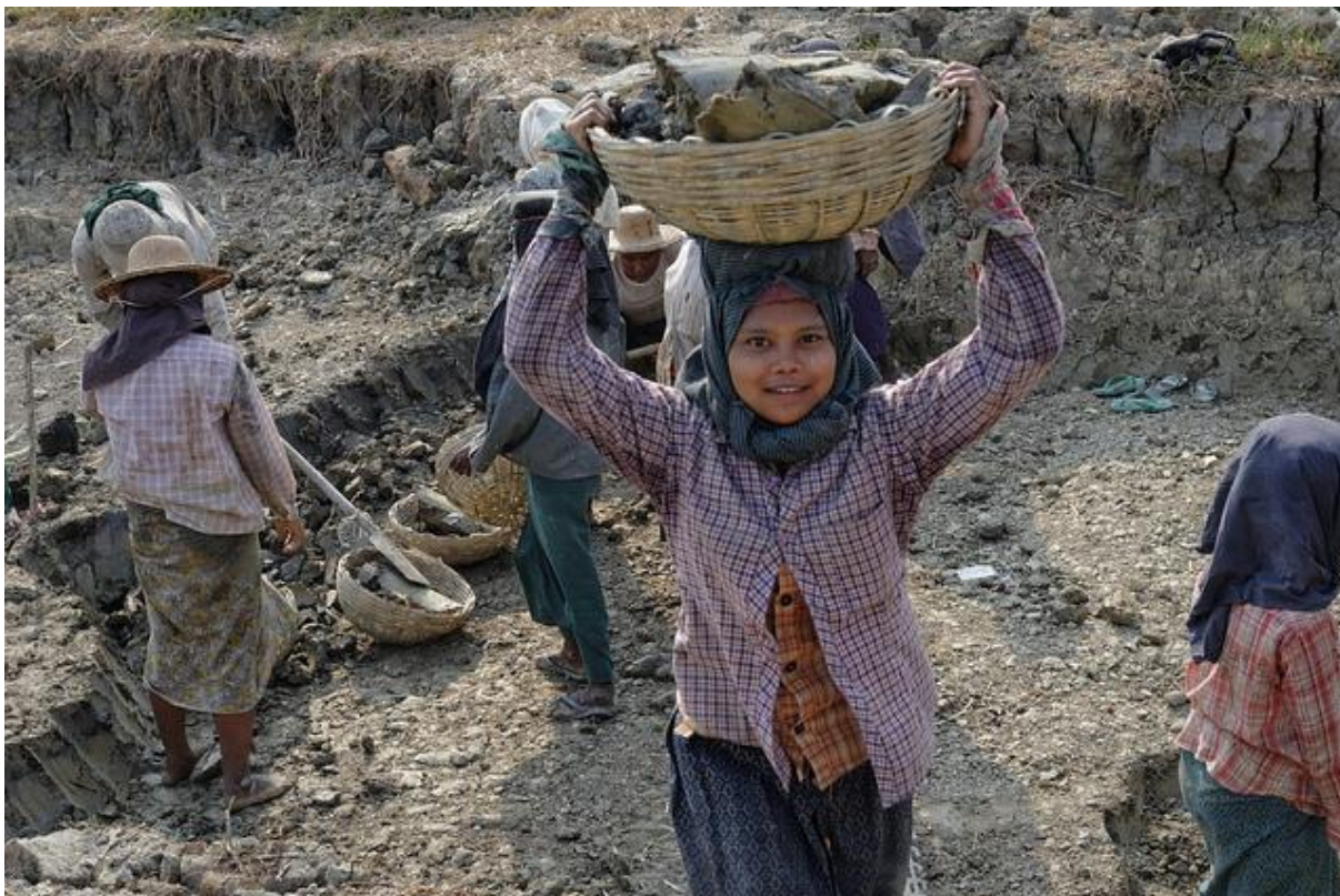
Dzieci pracujące przy wydobyciu gliny (Mjanma).